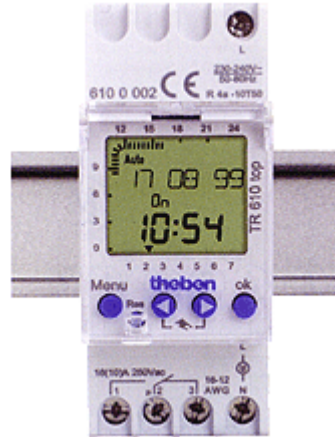
< TR 610 top >